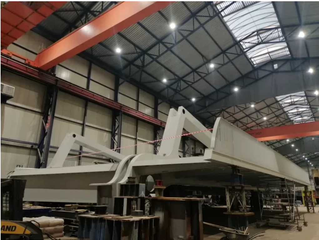
Momenteel wordt in de werkplaats in Wondelgem volop gewerkt aan de nieuwe Meulestedebrug.