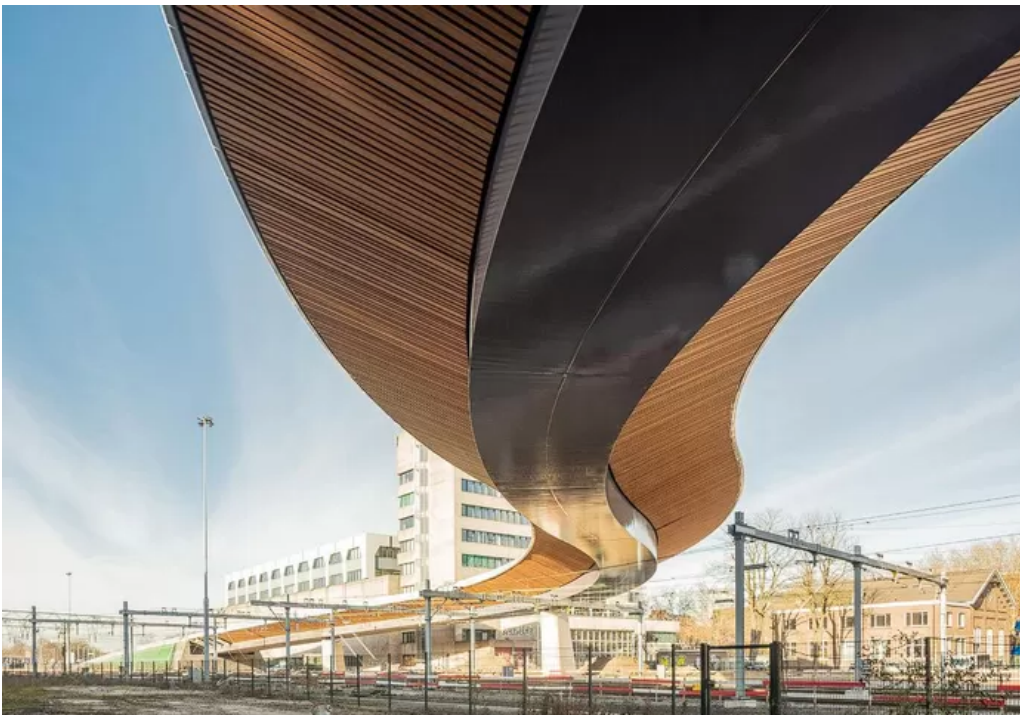
De Schuttebusbrug in Zwolle.